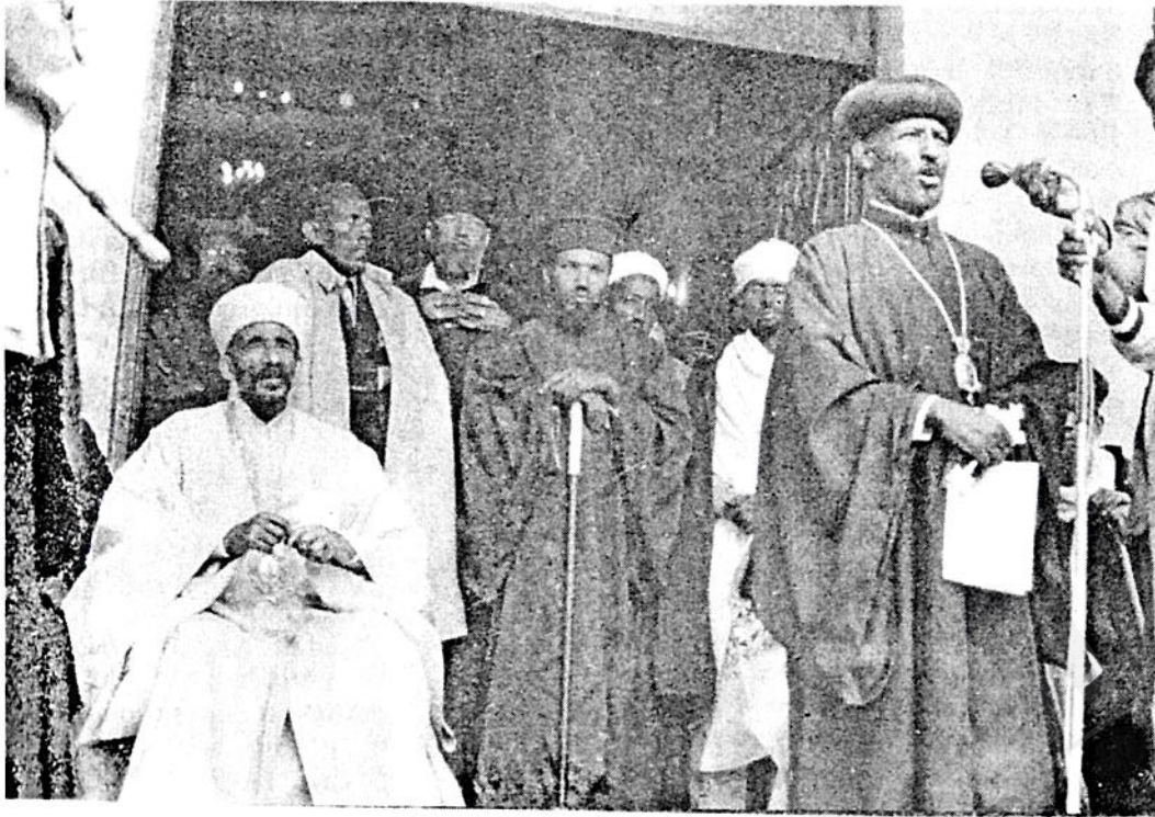
ቅዱስነታቸው በጅም ሙድጋኔ ዓለም ቤተ ክርስቲያን እንደተገኙ ብፁዕ አቡነ ኦሳሳዕ የሀገር ሰብከቱ ጳጳስ ስለቅዱስነታቸው ጉብኝት የተሰማቸውን ደስታ መግለጫ ሲሰጡ ።