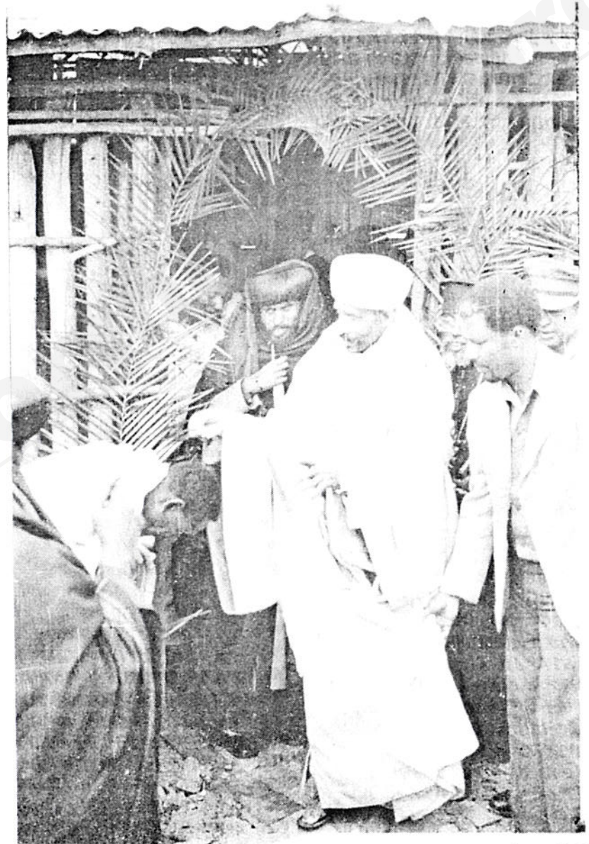
ፓትርያርኩ በጅም ከተማ አካባቢ የሚገኘው የቅዱስ ገብርኤል ጠበል ሲባርኩና ከተማዊዎቹም እንዴን ሲያጠምቱ ።