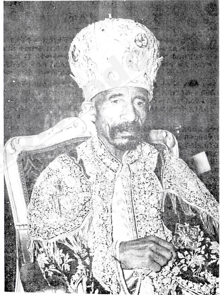
ብፁዕ ወቅዱስ አቡነ ተክለ ሃይማኖት ፓትርያርክ ርእሰ ሊቃና ጳጳስ ዘኢትዮጵያ ።