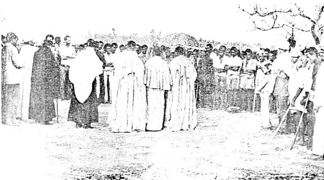
ፓትርያርኩ በአሰላ ሠፈራ ጣቢያ እዲስ በተሠራው የት/ ጊዮርጊስ ቤተ ክርስቲያን ተገኝተው ለተሰባ በሰው ሕዝብ አባታዊ ትምህርት ሲሰጡ ። ብፁዕ ወቅዱስ አቡነ ተክለ ሃይማኖት የገምቢን ከተማ በጉብኝቦት ወቅት የከተማው ሕዝብ ልባዊ አቀባበል ሲያደርግላቸው ።